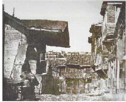
Büyük Beyoğlu Yangını Öncesi Beyoğlu'nda bir sokak

Çoğunluğunu konut ve ticaret yapılarının oluşturduğu kayıplar arasında otel, gazino, tiyatro ve elçilik binası gibi binalar vardı. Beyoğlu Belediyesi Altıncı Daire'nin raporuna göre bu yangında 65 cadde ve 163 mahalle içeren toplam 8.000 bina yok olmuştur. Yanan binaların arasında Beyoğlu'nun en zengin ve en ünlü kişilerinin evleri ve işyerleri de bulunmaktaydı[4]. Valide Çeşme, Feride, Sakız Ağacı, Kalyoncu Kulluk, Hamal Başı gibi Beyoğlu'nun en bilinen sokakları tamamen