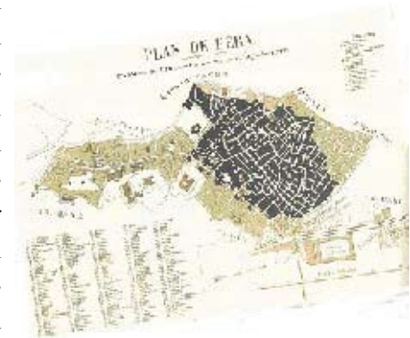
Büyük Beyoğlu Yangını Öncesi Beyoğlu'nda bir sokak

Büyük yangından sonra halk arasında “Ah Beyoğlu, vah Beyoğlu, Yandı da gitti kül oldu” şeklinde başlayan ağıtlar felaketin boyutunun bir göstergesidir. Felaketin böylesine büyük olmasının nedeni ahşap yapı yoğunluğu, yolların darlığı, yeterli söndürme suyu bulunmaması, söndürme malzemelerinin yeterli olmaması, yangın söndürme ekiplerinin organize olmaması gibi nedenler sayılabilir. Beyoğlu'nda hala girilemeyen dar sokaklar, yangın güvenlik önlemlerinin alınmadığı yüzlerce işyeri mevcut. Yangınları söndürmek için hala yeterli su bulunmamaktadır ve söndürme suyu taşıyarak getirilmektedir. Dünden bugüne