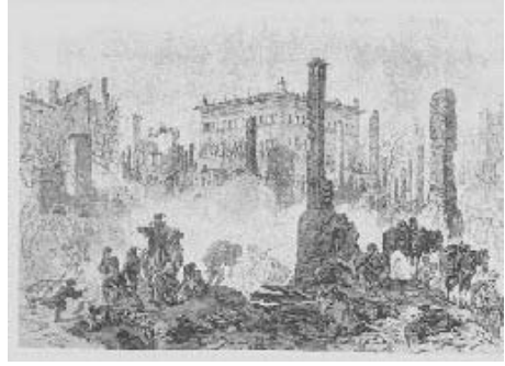
Büyük Beyoğlu Yangını Öncesi Beyoğlu'nda bir sokak

Büyük yangın, 1870'den itibaren Beyoğlu'nun Taksim-Galatasaray kesiminde geniş boş alanlar yaratmıştır. 1870 sonbaharında, evleri yananlar, yaklaşmakta olan kış sezonu için kentte kiralık ev bulma sıkıntısı çekmişler ve bu nedenle de, büyük bir çoğunluğu kış dönemini yazlık evlerinde geçirmişlerdir. Belediye, yangın yerinde kış dönemi için barakalar yapılmasına izin vermiş, kısa süre içinde açık alanlar barakalarla dol-