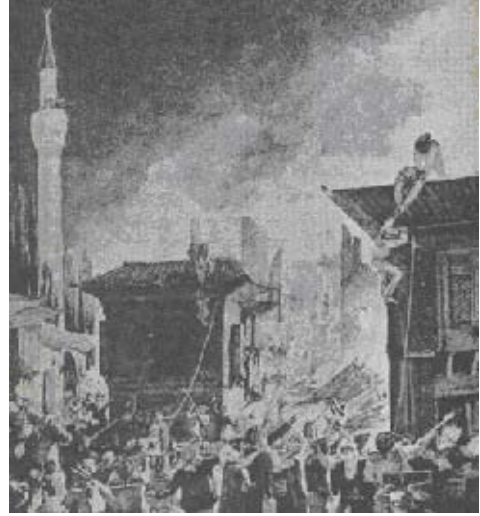
Tulumbacıların Beyoğlu'nda yangın söndürme çalışmaları

Büyük Beyoğlu yangından sonra, Beyoğlu'ndaki elçilikler, yabancı misyonlar, Laventenler kendilerine yeni bir yerleşim alanları aramışlar, bir yandan