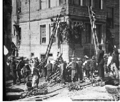
Tulumbacılar bir tatbikatta

O tarihlerde, Beyoğlu’da binaların çoğunluğu ahşap yapılardan oluşmaktaydı. Özellikle konutlar büyük çoğunlukla ahşaptı. Ahşap evlerde oturanlar, alevler uzandığı takdirde her şeylerinin yok olacağını bildikleri için evlerini boşaltıp öncelikle canlarını garantiye almışlardır. Kagir binalarda oturanlar ise, yapılarının kagirliğine güvenerek eşyalarına ve canlarına bir şey olmayacağını düşünmüşlerdir. Özellikle bodrumlara sığınmak suretiyle kurtulacaklarını sanmışlardır. Bu yüzden Beyoğlu yangınında pek çok insan ya yanarak ya da dumandan boğularak can vermiştir. Kalyoncu Kulluğu tarafında kagir bina çok olduğundan, pencerelerinin demir kepenkleri ile kapılarını kapatarak evlerinde oturup yangından kurtulacaklarını sananlar daha çok olmuştur[1].